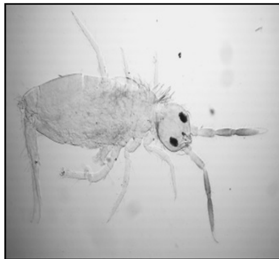
Figura 2. Colémbolo Seria sp., colectado en hojarasca y suelo en sistemas de manejo de mango Manila en la región centro de Veracruz, México.

1 Sistemas de manejo: S1-Tecnificado; S2-Transición; S3-Mínimo; S4- Tecnificado con caña de azúcar.