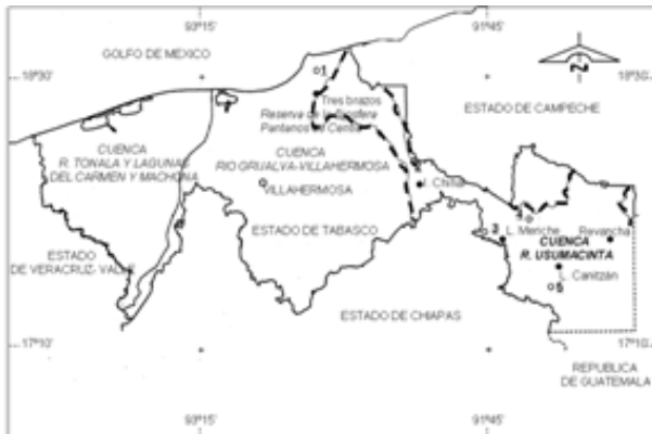
Figura 2. Localidades con peces infectados por larvas de tercer estadio avanzado de Gnathostoma sp en la cuenca del río Usumacinta: (1) Tres Brazos en Centla, (2) Isla Chinal a en Jonuta, (3) Laguna Meriche en Emiliano Zapata, (4) la Revancha (Río San Pedro) a en Balancán, (5) Laguna Canitzán y Sociedad Cooperativa Tenosique el Grande a en Tenosique ( a = nuevo registro de localidad).

Figure 1. Advanced third-stage larva of Gnathostoma sp. obtained from Vieja synspila muscle.